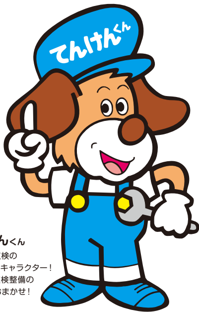
てんけんくん マイカー点検の マスコットキャラクター！ クルマの点検整備の ことならおまかせ！