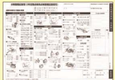
自家用乗用車の点検整備(分解整備)記録簿

これはいわば、クルマの健康カルテ。エンジンやブレーキをはじめ、さまざまな箇所の点検・整備の内容が記録されています。